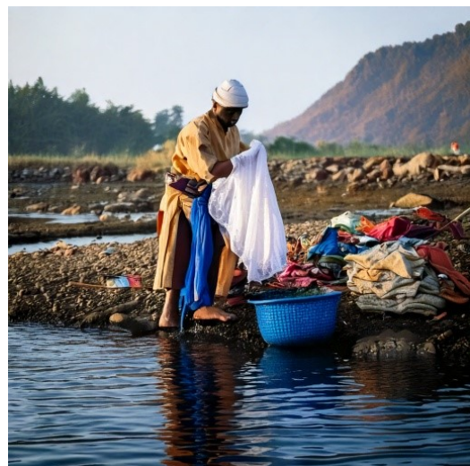
Imagen generada por la inteligencia artificial de Adobe Firefly usando las palabras claves “hombre alpha lavando ropa en un rio”.