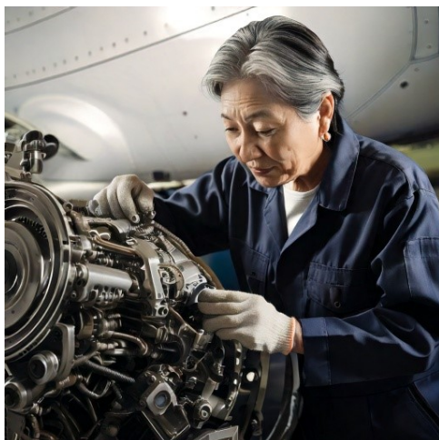
Imagen generada por la inteligencia artificial de Adobe Firefly usando las palabras claves “mujer de tercera edad en ropa de mecanico”